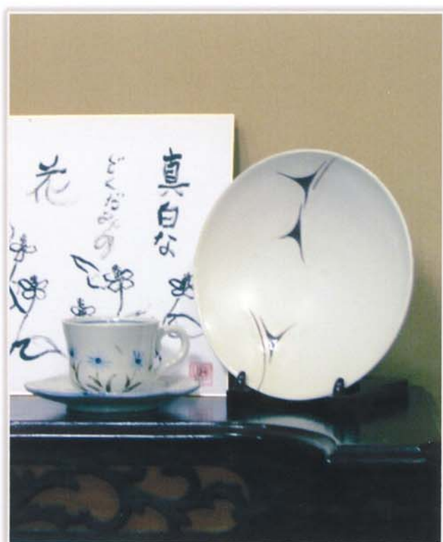
Cafe'プレイエル所蔵リードオルガンと共に